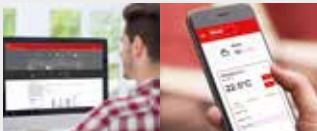
Plate-forme IdO HovalConnect